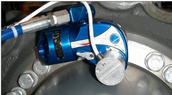
MXT-3 en el ensamble de una unidad Caterpillar, de acuerdo al ángulo de rotación seleccionado.