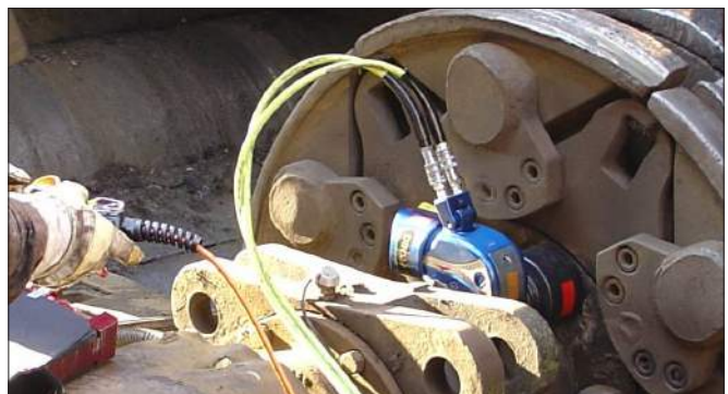
MXT-10 utilizada en una prensa de chatarra.