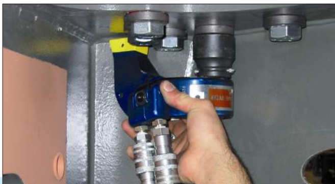
MXT-1 para construcción de vehículos.